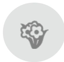
Αυλή & Εξωτερικοί χώροι

Ανάλογα με τη διαθέσιμη επιφάνειά της ξενοδοχειακής σας μονάδας μπορείτε να επιλέξετε να χρησιμοποιήσετε το Net Metering μερικώς ή να παράγετε το σύνολο της ενέργειάς σας από αυτό. Πραγματοποιώντας: