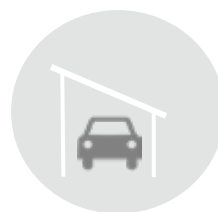
Σκίαστρο για Parking